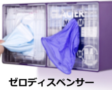
ゼロディスペンサー